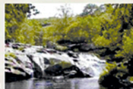
Torrents of Mácara Rapids in the river Ulla