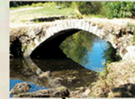
Ponteferreira Puente Romano Bridge of Ferreira Roman bridge