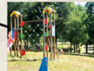
Chacotes Área recreativa Chacotes Recreational area