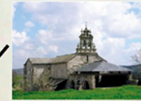
Iglesia de Vilar de Donas Iglesia románica del s.XIII Church of Vilar de Donas 13th century Romanesque church