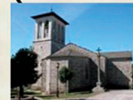
Iglesia de San Tirso Iglesia de origen románico (s.XII) Church of San Tirso 12th century church with Romanesque origins