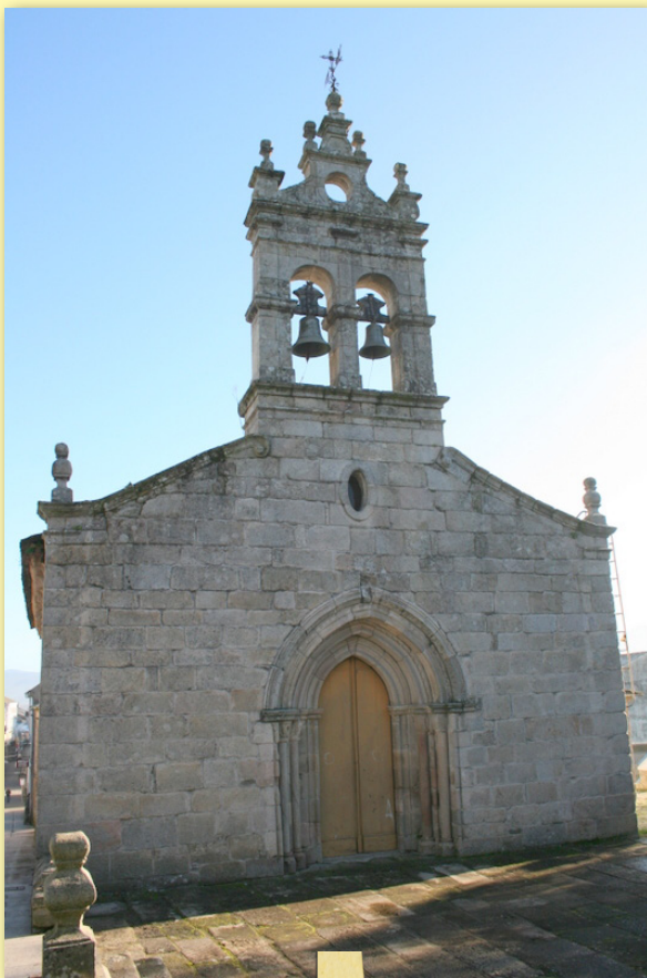
Igrexa de San Salvador