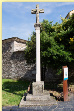
Cruceiro Capela de San Lázaro

Único resto del antiguo hospital de San Lázaro, que estuvo destinado a la atención de leprosos hasta el año 1700. A su lado hay un cruceiro de Manuel Mallo. Es una pequeña capilla con porche ( s. XVIII ), inmediata a la Rúa do Porvir ("Rúa dos Anticuarios"). En esa calle se pueden visitar varias tiendas de anticuarios, con una variada y rica oferta.