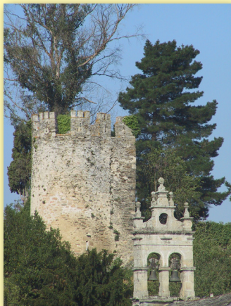
Campanario San Salvador y Torre Fortaleza

tiene arco ligeramente apuntado, formado por arquivolta de baquetilla, capiteles con hojas y bastones y una cabeza humana. En el tímpano se ve, para unos la figura de Cristo Majestad, y para otros autores la de Melquisedec, y aún la del rey David, en actitud de bendecir, con ingenuos rasgos, en medio de árboles esquematizados, rematados por una cruz griega (cruces inscritas en círculos); los canecillos de la parte norte representan cabezas humanas, rollos, rosetas, puntas de clavo. Hay en esa fachada numerosos signos lapidarios. Son notables los herrajes ornamentales, también de época medieval, existentes en la puerta norte.