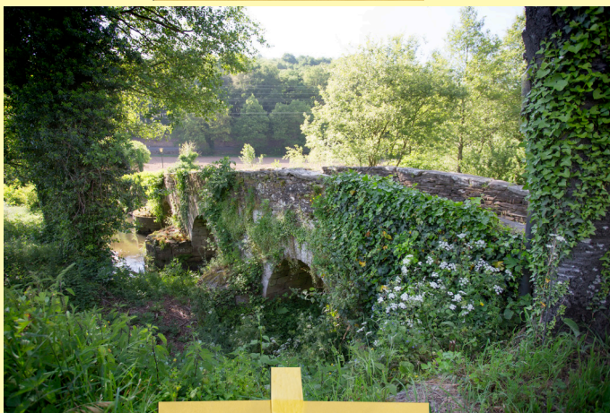
Ponte da Áspera