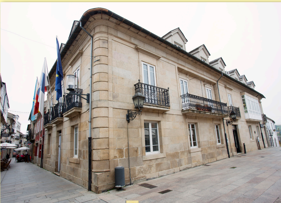
Casa do Concello