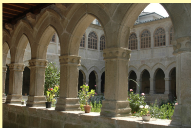
Claustro Mosteiro da Madalena

Un magnífico escudo agustiniano , bordeado por la leyenda “Sicut aquila incitans ad volandum pullos suos”, y varios escudos de las familias nobles que señorearon la comarca embellecen el conjunto. Además del Convento e Iglesia de la Merced el edificio principal y anexos acogen un centro de enseñanza y un albergue , heredero de la primitiva fundación.