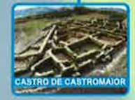
CASTRO DE CASTROMAIOR

Avenoste Aírexe Ventas de Narón Hospital de la Cruz Castromaior Gonzar 24,5 Km 20 km 15 km 10 km 5 km